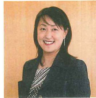
メディセレスクール 代表取締役社長

①自己認識力：自分の本当の気持ちを認識して大切に、自分が納得できる決断を下せる能力。